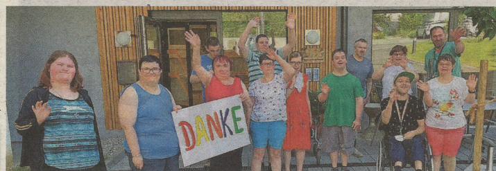
13 neue Mieter freuen sich über ihre eigenen Wohnungen, die mit Hilfe der Sobeges entstanden sind.