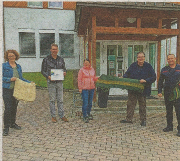
Sandsackübergabe an die Gemeinde von Ratten. KLAR! Oberes Feistritztal

Jugendliche der Mittelschule Strallegg besuchten mit der „KLAR!“ den „Urwald“ des Augustiner-