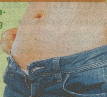
Abbildung Betroffener nachempfunden Über die Wirkung und mögliche unerwünschte Wirkung informieren Gebrauchsinformation, Arzt oder Apotheker.

Darmmuskulatur sanft. Sie erhält dadurch den Impuls, sich wieder normal zu bewegen. Der Darm kommt auf natürliche Weise wieder in Schwung und die Verstopfung löst sich – planbar und zuverlässig. Zusätzlich reduziert Kijimea Regularis die Gase im Darm und lässt somit auch den Blähbauch verschwinden. Kijimea Regularis ist rezeptfrei in der Apotheke erhältlich.